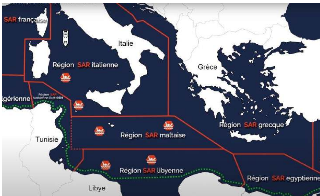
Les différentes SAR zones en Méditerranée.

C'est un appel comme il y en a des centaines, lancés depuis des années, par les ONG présentes en mer Méditerranée. "Urgent : un canot coule actuellement en Méditerranée. Il s'est dégonflé et 12 personnes sont dans l'eau depuis plus de deux heures, probablement pour réduire le poids et protéger les 4 enfants à bord. LES AUTORITÉS IGNORENT NOS APPELS À L'AIDE ! (sic)". Cet appel de détresse a été lancé par l'ONG allemande Sea Watch, le 26 août 2024 à 17h. Ce jour-là, leur avion de reconnaissance, le Sea bird, survole la Méditerranée et repère le canot dégonflé et plusieurs personnes dans l'eau. Sea Watch demande en urgence l'aide des garde-côtes italiens, mais ces derniers les renvoient vers les Tunisiens, officiellement en charge de la zone maritime où se trouve le canot.